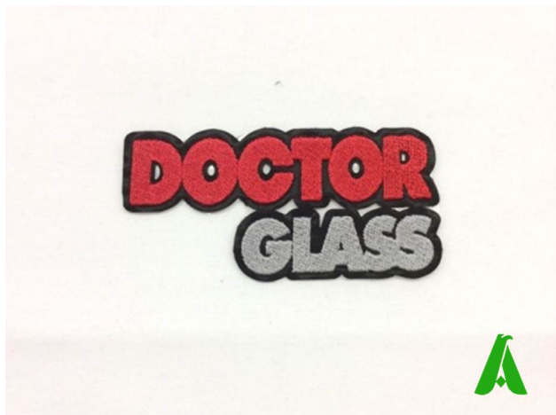
Bestickte lasergeformte Patches