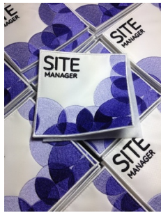
Besetzte Patches der Arme auf Klettverschluss