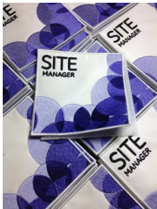
Besetzte Patches der Arme auf Klettverschluss